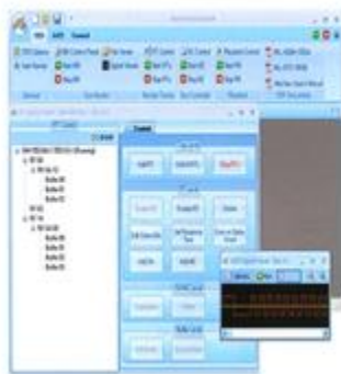
1553/ARINC アナライザーソフトウェア

Data Bus Analyzer - Alta のアビオニクスアナライザー製品 (AltaView) は、MIL-STD-1553 ARINC-429 ネットワークとデータ分析のために最新のテクノロジーを提供します。AltaView は、統合とテスト時間の減少に貢献します - それはプロジェクトにとって時間と費用の節約となります。